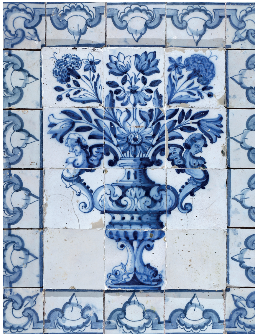
F1054 — “ANFORA COM FLORES” Faiança Portuguesa, Portugal, séc. XVIII (1. a metade) Dim.: 75,0 × 90,0 cm (30 azulejos)