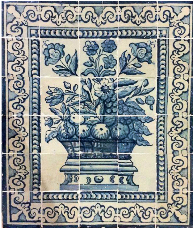
F1052 — “ALBARRADA”

La Biennale des Antiquaires — Paris 11–17 Septembre 2017 — Grand Palais