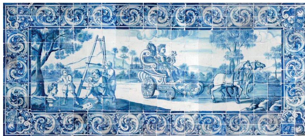
F1049 — “ALEGORIA ÀS ARTES” (MÚSICA E PINTURA COM DESENHO DE ESTÁTUA)

Faiança Portuguesa, Portugal, séc. XVIII (1. a metade)