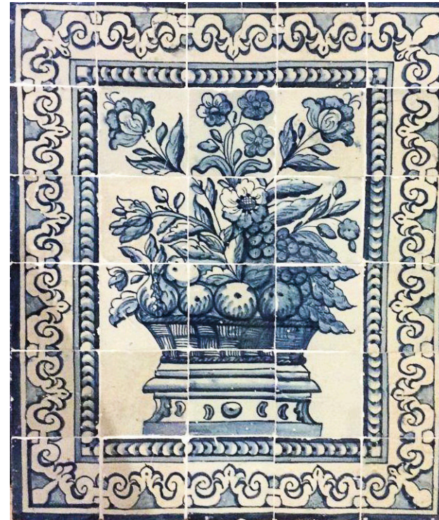
F1053 — “ALBARRADA”

Faiança Portuguesa, Portugal, séc. XVIII (1. a metade)