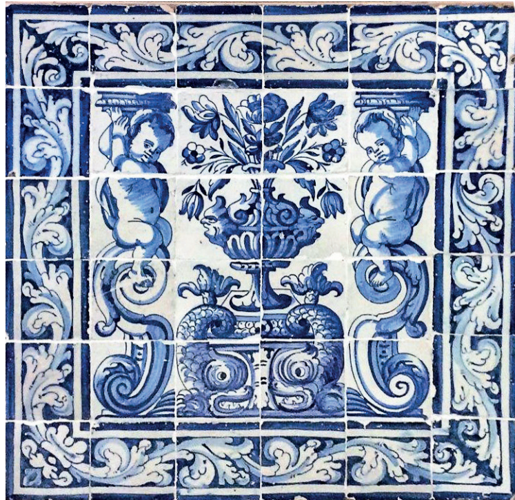
F1055 — “ALBARRADA” COM ENQUADRAMENTO DE PUTIS E GOLFINHOS

La Biennale des Antiquaires — Paris 11–17 Septembre 2017 — Grand Palais