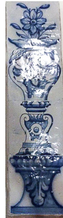
F1056 — 2 JARRAS OU PALMITOS (SEPARADORES DE ALBARRADAS)

Faiança Portuguesa, Portugal, séc. XVIII (1.ª metade)